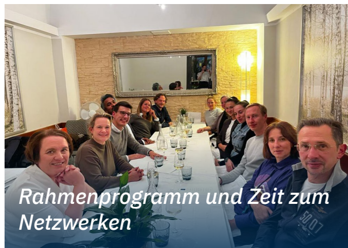
Rahmenprogramm und Zeit zum Netzwerken