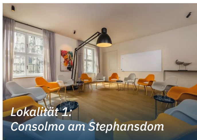
Lokalität 1: Consolmo am Stephansdom