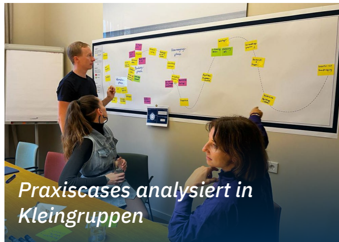
Praxiscases analysiert in Kleingruppen