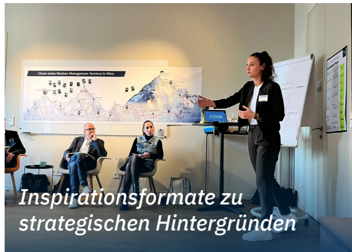
Inspirationsformate zu strategischen Hintergründen