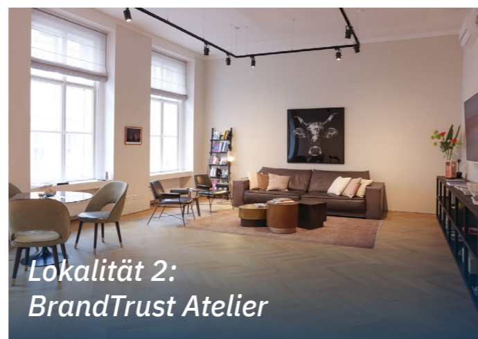
Lokalität 2: BrandTrust Atelier